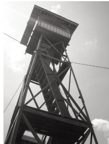
写真1 NTFPサゴヤシプランテーション内のタワー。