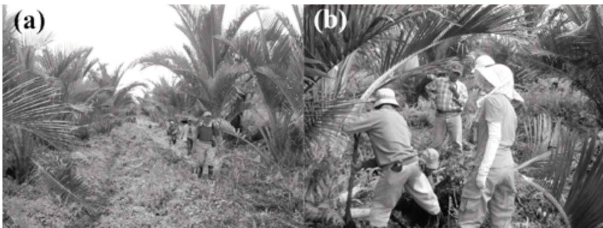
写真3 2003年に開設した施肥試験区。(a)から試験区への道、(b)土壌採取(2004年7月)。

そこで、2003年6月に移植後5年を経過したサゴヤシを対象に施肥量を大きくふった試験区を新たに開設した(写真3)。看板(写真4)には“日本の山形大学との共同研究”とあり、寂しくはないが名古屋大学は忘れられたようである。