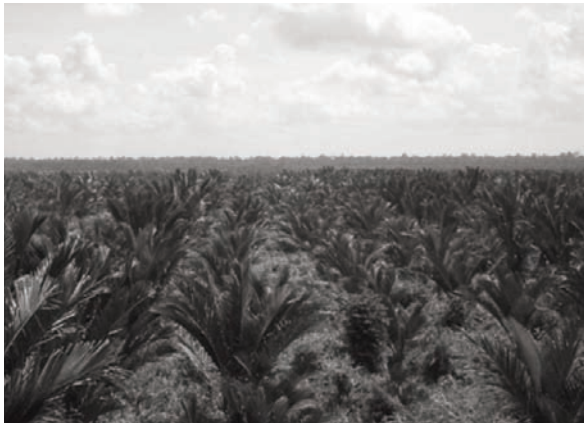
写真2 タワーから見たサゴヤシプランテーション。

kg y -1 ) の100倍量の添加が必要であり、効果を得ることは容易ではない。さらに残念なことに、この試験は2003年に起こった原因不明の出火によって継続不可能となった。なお、2002年9月まで処理区間で明瞭な生育量および生育速度の差異は認められていなかった。