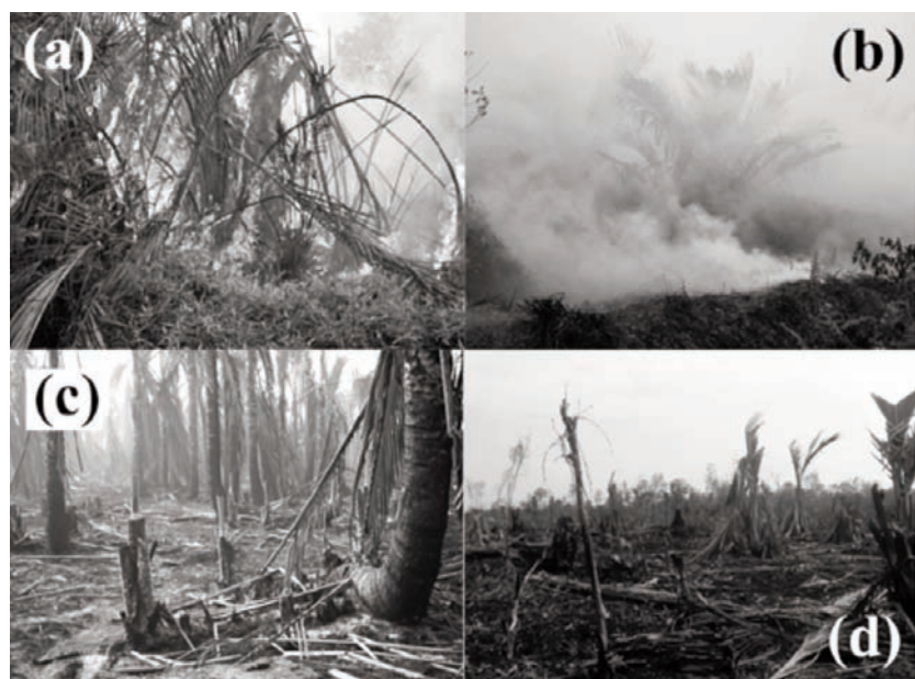
写真5 (a)燃えているサゴヤシ、(b)煙に包まれているサゴヤシ、(c)火災後のサゴヤシ分枝、(d)燃え残ったサゴヤシの再生(2005年5月)。(a)~(c)はDr Jongの撮影による。

ところで、当該地域では2005年2月に再び原因不明の出火が起こった(写真5)。この時期は本来雨季に相当するが、その期間は一定ではなく、特に2005年は1月初旬から雨の降らない日が続いた末のことであった。この火事は3月下旬の降雨により鎮火したが、NTFPのプランテーション1000 haおよび農家のサゴヤシ園3000 haが焼失した。試験区は無事であったが、調査地点のいくつかは被害にあった。熱帯泥炭地では乾季に大規模な火災が発生することは決して希では