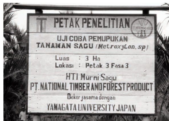
写真4 施肥試験区の看板。

り、各Phaseに管理責任者が配置されている。栽培されているサゴヤシはいわゆるトゲのあるサゴ(Metroxylon sagu)で、栽植密度は植物間距離にして8×8mまたは10×10mある。近くからは計画的に植えられていることはわかりにくい、写真1にある高さ約10mの塔から見下ろした際のサゴヤシが整然と並んでいる景色は壮観である(写真2)。著者らは当初Dr Jongが設計し、1997年から行われていた施肥試験区においてサゴヤシ葉成分への施肥効果の検証から調査を始めた。施肥設計は、Flach and Schuiling (1989)が報告したサゴヤシ養分吸収量から設定した本プランテーションの多量要素、微量元素慣行施用量(Jong, 2001b)を基準とし、そこから各種要素を欠落させたもの、さらにドロマイトを加えたものから成り、処理区数は20区を数えた。しかしながら、ドロマイトの添加によるpH矯正を期待するのであれば、少なくとも本試験の添加量(サゴヤシ1本当たり2